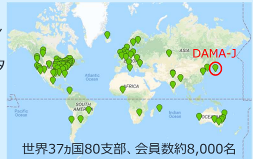
「Google Map より編集」